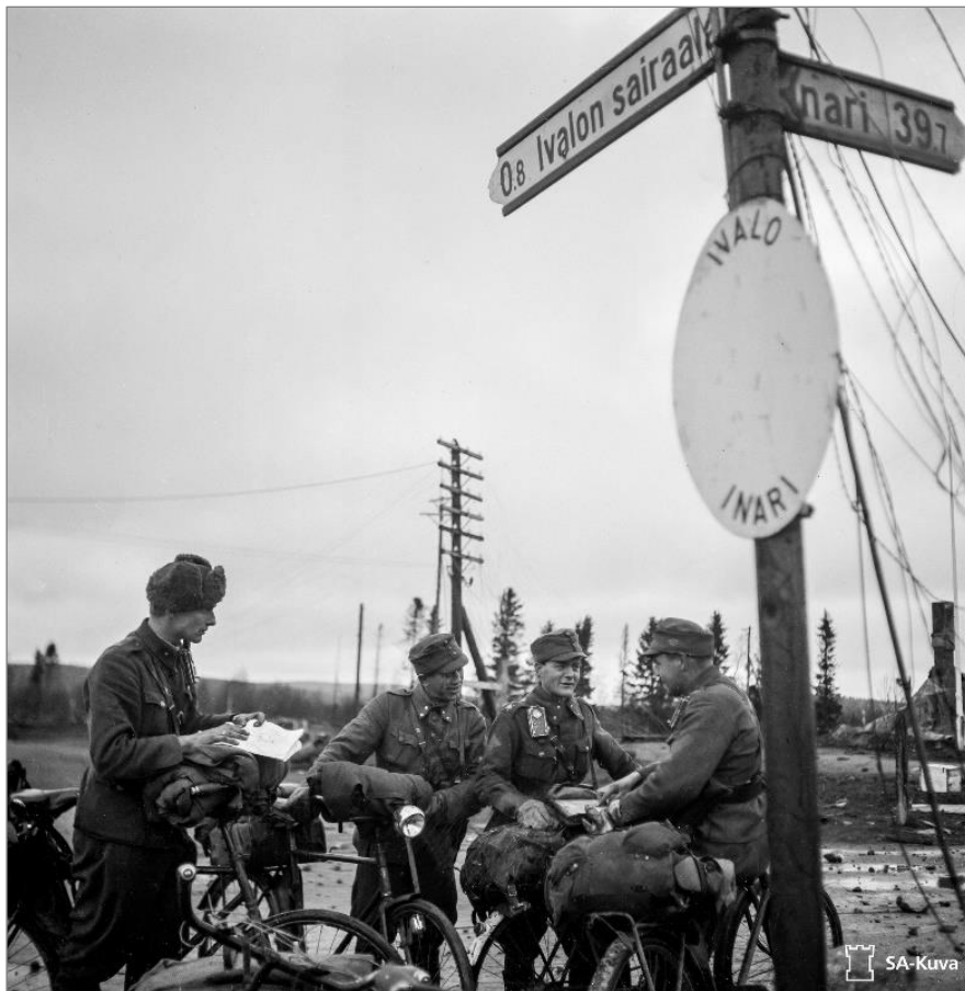
Suomen rajajääkäriprikaatin ja puna-armeijan sotilaat kohtasivat Ivalon risteuksen alueella ensimmäisen kerran 5.11.1944.