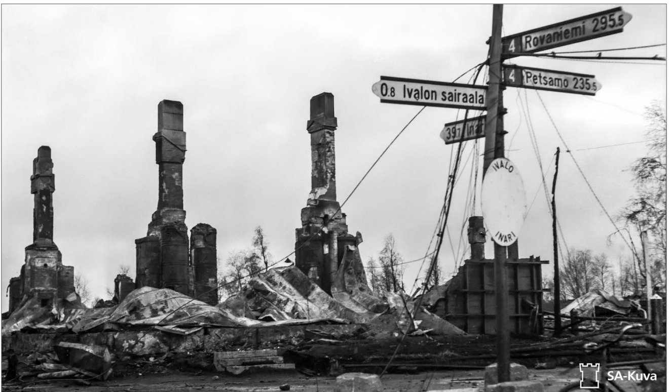
Saksalaisjoukot käyttivät vetäytyessään poltetun maan taktiikkaa.

Ivalo on paikkakunta, jossa on lyhyellä aikavälillä operoinut kolmen valtion sotavoimia. Saksan 20. vuoristoarmeijan joukot vetäytyivät marraskuun 1944 alkuun saakka Ivalon kautta kohti Norjaa. Neuvostoliiton puna-armeijan joukot marssivat Petsamosta vetäytyvien saksalaisjoukkojen perässä Suomen rajan yli Ivalon alueelle. Lopulta Ivaloon ehtivät etelän suunnasta etenevät suomalaisjoukot. Vetäytymisen aikana saksalaisjoukot tuhosivat rakennukset ja sillat, sekä tuhosivat, miinoittivat ja murrettivat vetäytymisreittiä ja sen reuna-alueita. Ivalon taajama-alueelta jäi saksalaisjoukkojen jäljiltä pystyyn vain Ivalon rukoushuone. Jäniskoskelta saksalaisjoukot tuhosivat perusteellisesti myös voimalaitoksen ja voimalaitospadon rakenteet.